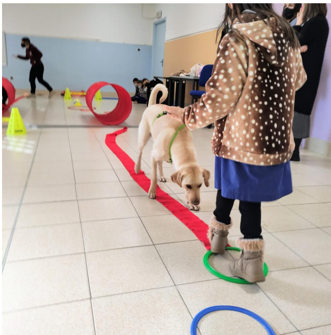
Immagine 1: Frida, cane Coterapeuta insieme ai bambini della scuola primaria svolgono un percorso di psicomotricità.