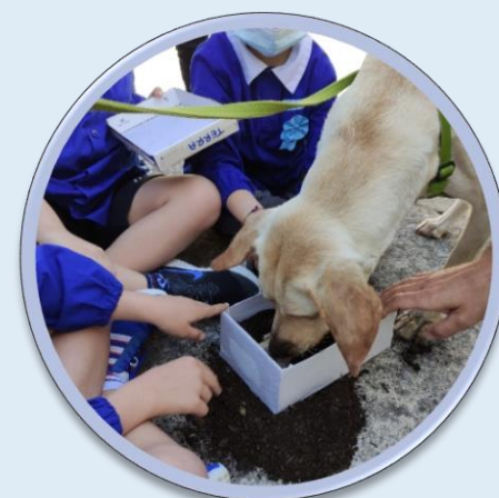
Immagine 2: Frida mostra come si effettua una ricerca olfattiva nella terra. Il gruppo supporta la ricerca e osserva con interesse

L'approccio CZ (cognitivo-zooantropologico) considera ogni animale nella sua individualità, con interessi propri espressi con emozioni e motivazioni. L'animale è dunque un collega attivo all'interno dei progetti.